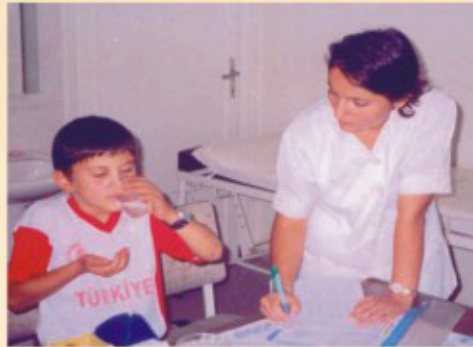
İlaçları hergün hemşire gözetiminde içen hasta

Birçok hasta düzenli ilaç kullanamadığı için, ilaçlar bir sağlık personelinin gözetiminde içirtilir. Buna doğrudan gözetimli tedavi (DGT) denilir.