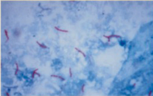
Üste: 1000 kez büyütülmüş verem mikrobuunun mikroskopta görünüşü

Mikroskopta balgam incelenir ve mikrop gösterilince tanı konulur. Bazı hastalarda özel besiyerinde mikrop üreyince tanı konulur