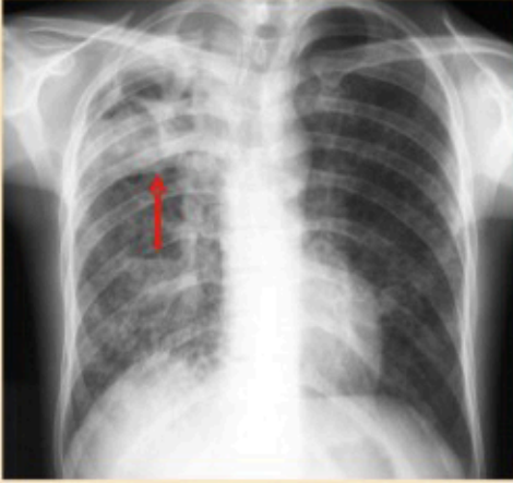
Verem hastasının akciğer filminde sağ üstte tutulum.

Akciğer filmi çekilir. Akciğer filminde verem hastalığını düşündüren bulgular varsa verem mikrobuunu görmek için balgam incelemesi istenir.